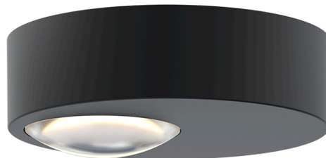
Head ø 16,5 cm × H 4,6 cm